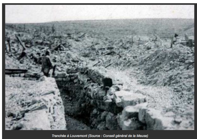
Tranchée à Louvemont

Le mercredi 27 décembre 1916, il est « tué à l'ennemi » dans le secteur de Louvemont-Côte-du-Poivre, près de Verdun (Meuse).