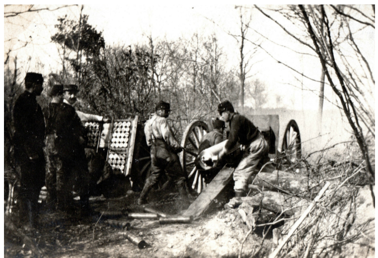
Canonnier servant (image d'illustration)

Acte de décès transcrit le 17 juillet 1918 dans les registres de l'état civil de Pontault-Combault.