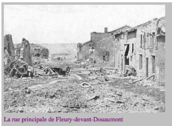
La rue principale de Fleury-devant-Douaumont

La bataille de Fleury a duré deux mois (23 juin -18 août 1916), le village a changé 16 fois de mains au cours des combats.